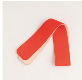
着物ベルト (伊達締め、紐で代用可)