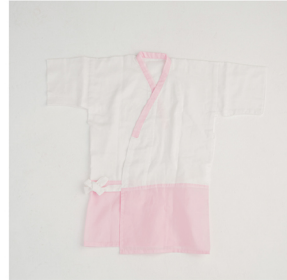
肌襦袢・裾よけ (肌着でも可)