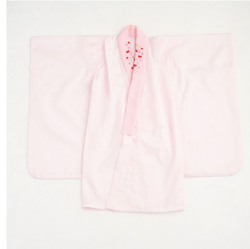
長襦袢 (半襟がついたもの)